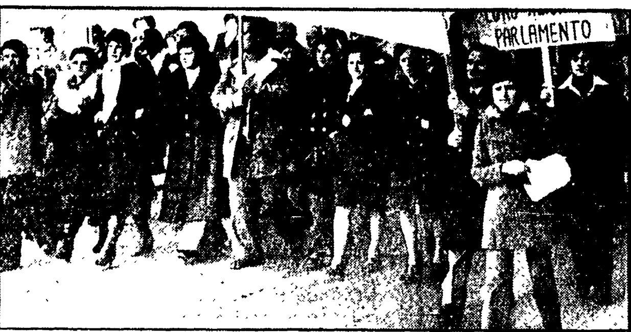
Una manifestazione dei lavoratori della Lebole

L'ENI sembra voler far marcia indietro sul settore tessile abbigliamento. Appena qualche mese fa aveva definito un verbale d'accordo con le organizzazioni sindacali nel quale dichiarava il suo impegno in questo settore, da concretizzarsi nel risanamento delle aziende.