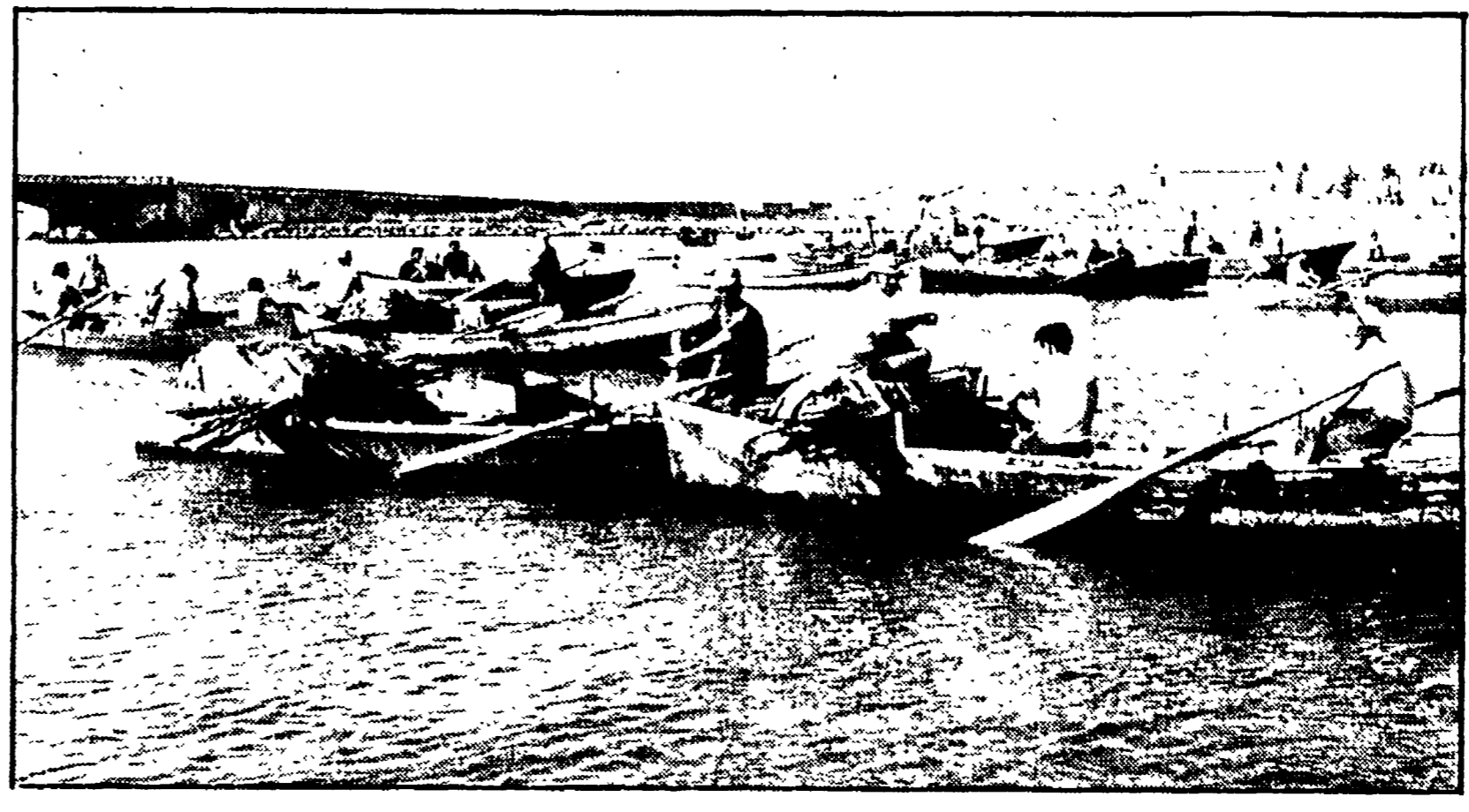
Sfileranno in corteo lungo le strade di Cagliari i pescatori dello stagno

«L'occupazione in provincia di Foggia le numeri non accennano a diminuire... Da molti mesi nessun problema in questa direzione è stato finora positivamente risolto. Anzi, la minaccia di nuove chiusure e di crisi occupazionali è più consistente che per altre fabbriche, relativamente «tranquille», come ad esempio l'ANIC di Marone...»