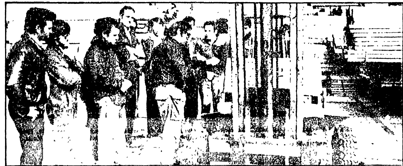
Il carrello elevatore di cui era alla guida il portuale deceduto

Il drammatico incidente pochi minuti dopo l'inizio del lavoro - La sua famiglia era molto conosciuta nel porto dove hanno lavorato altri suoi parenti - Il lavoro al porto si è fermato tutto il giorno