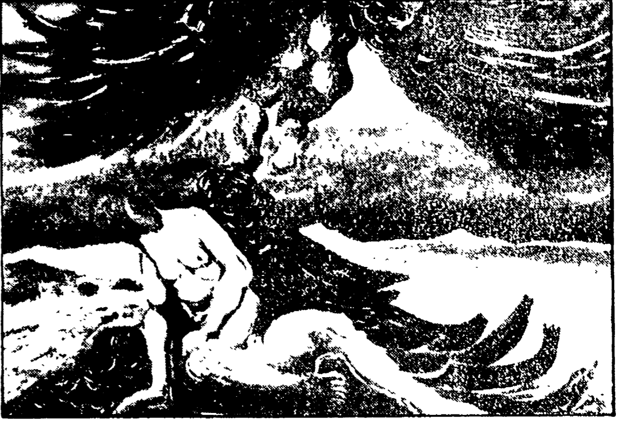
Le opere di Alberto Savinio: sopra «Linea di una battaglia» (1930); a sinistra «Annunciazione» (1932); a destra «I genitori» (1931)