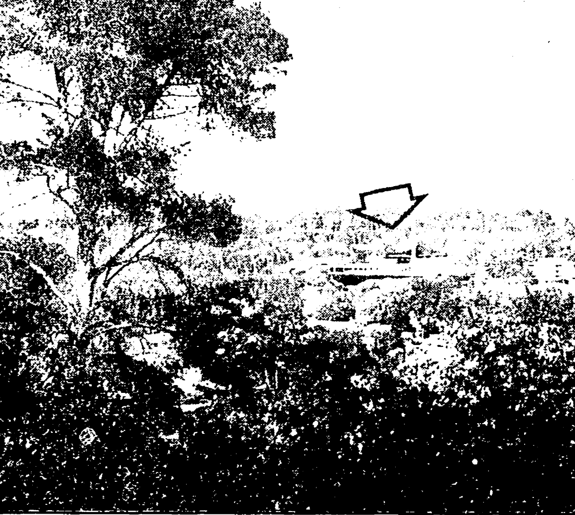
Ecco (in un montaggio) come apparirà a costruzione ultimata Monte Antenne guardandolo da Villa Glori, indicato dalla freccia il profilo del centro islamico

La commissione edilizia del comune ha approvato la localizzazione e il progetto