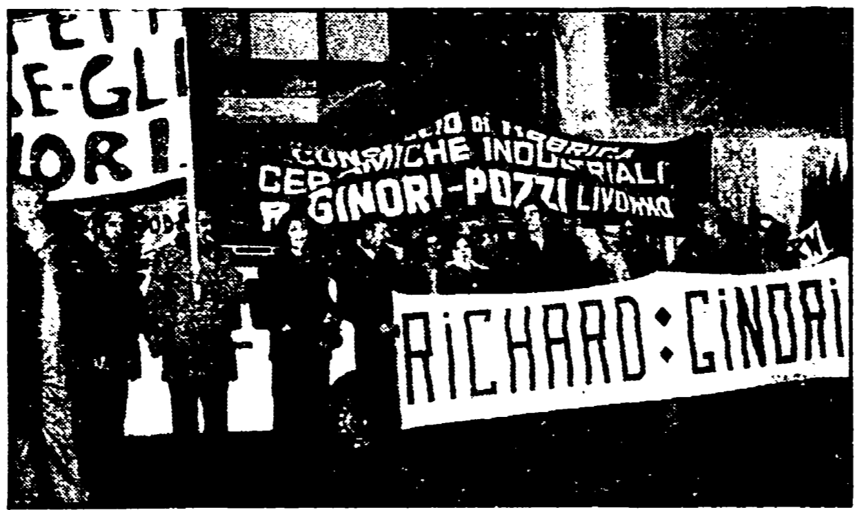
La torre di Pisa ancora occupata dai lavoratori Richard-Ginori