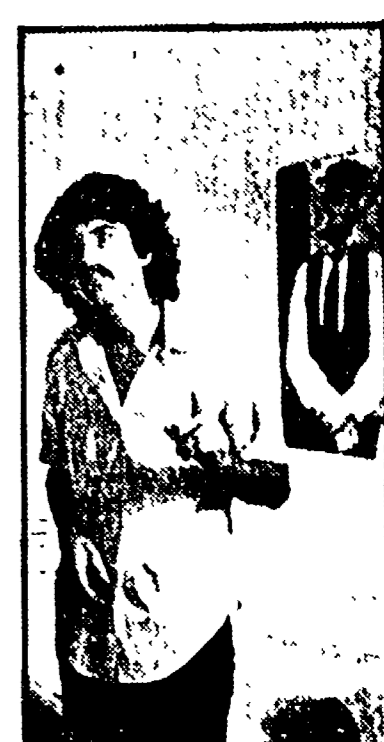
Nanni Moretti, attore e regista di «Ecco biondo»