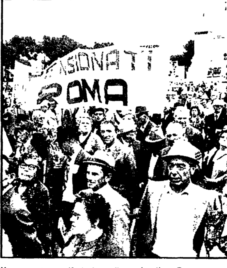
Una recente manifestazione di pensionati a Roma