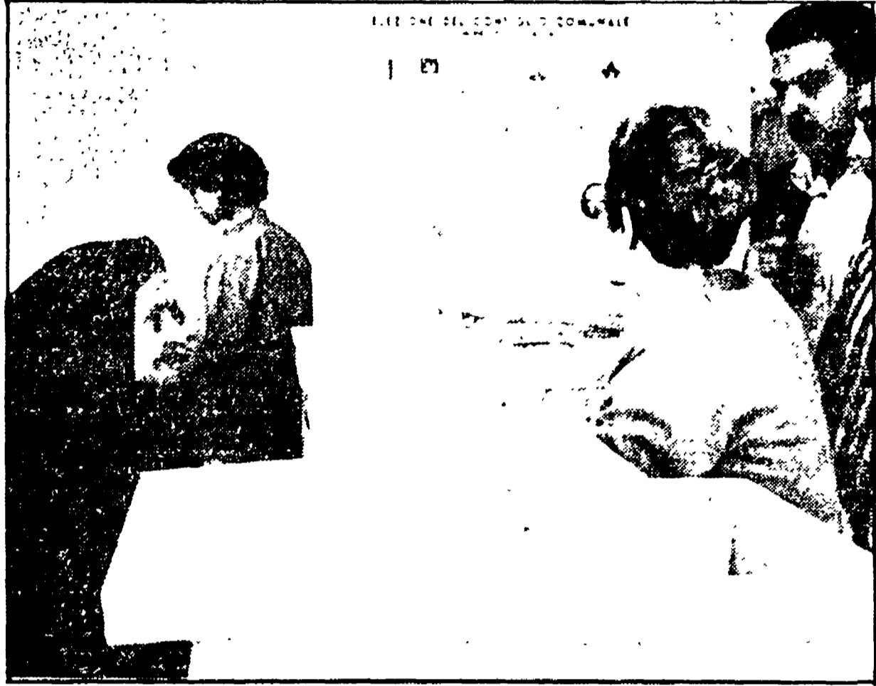
Cittadini votano in un seggio di S. Flavia in Sicilia

Una conferma solo parziale delle tendenze del 14 maggio - Una flessione socialista ed un'avanzata della DC più contenuta rispetto al precedente turno - Nei grossi centri il PCI avanza del 3,65 per cento rispetto al '73, mentre il 14 maggio nei comuni sopra i 10 mila abitanti era calato dello 0,53 per cento - Dichiarazione di Lo Monaco