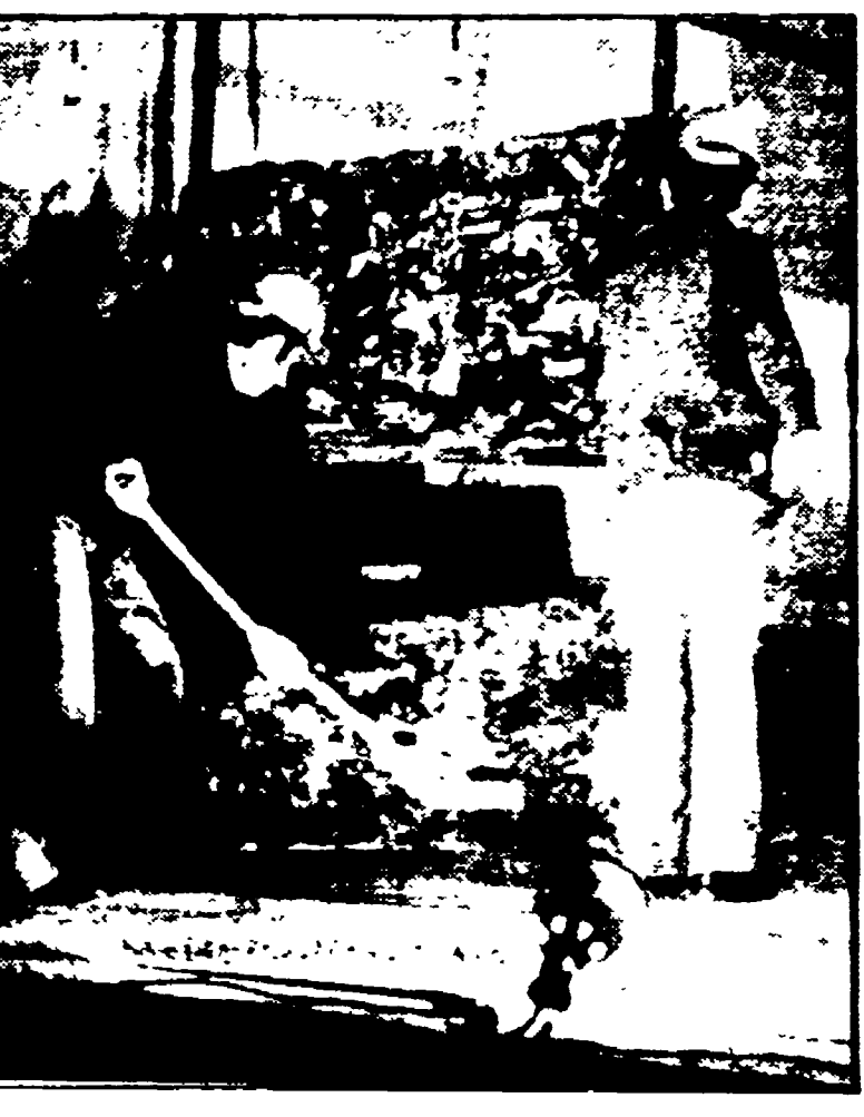
Uno spettacolo della coop « Gruteater »

laboratorio aperto al quartiere, capace di aggregare tutti quelli che sono interessati a questo tipo di attività in particolare i giovani. La nostra ricerca parte sempre dal territorio e, in base al progetto che noi abbiamo elaborato, prevediamo che intorno all'attività teatrale si sviluppino una serie di iniziative culturali, che si avvalgano dell'utilizzazione di altri mezzi di comunicazione, come appunto la fotografia, il videotele, il ciclostile. Questo non significa che rispetto al teatro, questi mezzi avanzati, non abbiano una funzione marginale. Faccio un esempio, noi pensiamo di utilizzare la fotografia come strumento per documentare quella che è la realtà del territorio.