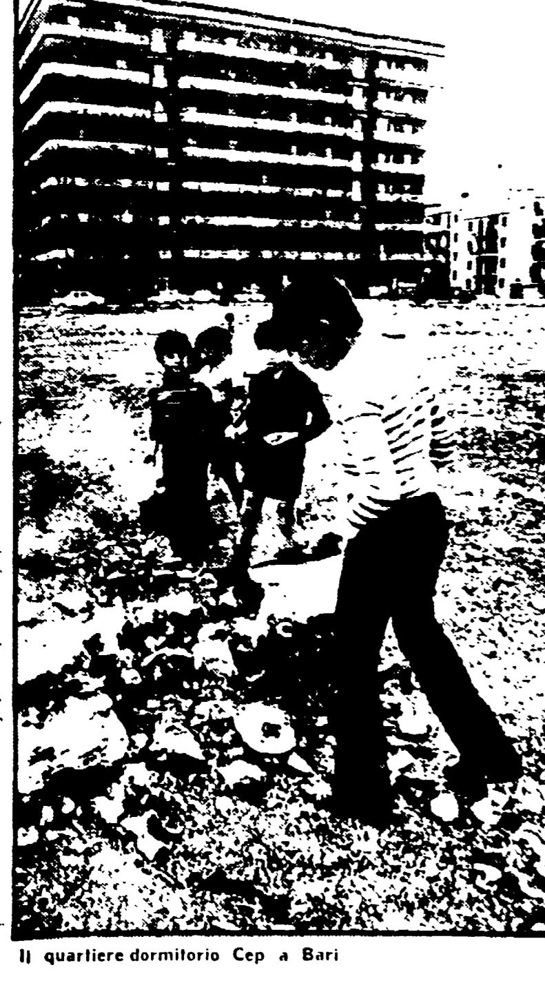
Il quartiere dormitorio Cep a Bari

Entrambi: questi punti erano stati concordati tra giunta, gruppi consiliari ed organizzazioni sindacali in un incontro del 16 marzo scorso. In quella sede si decise, in fatti, di affidare la gestione dei corsi alle organizzazioni sindacali tramite i loro enti che svolgono a livello nazionale attività di formazione professionale.