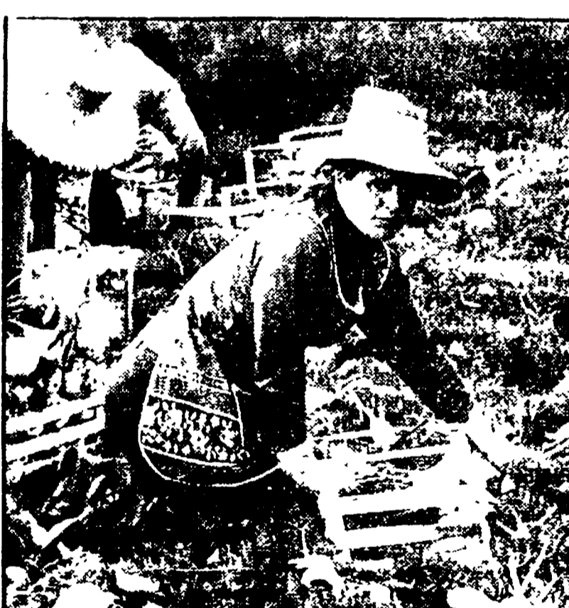
Proseguono gli incontri per salvare la Maccarese

ROMA - Altri dieci giorni di tempo per contabile e la vertenza Maccarese. Il comitato di presidenza dell'Iri, creato ieri, ha deciso di continuare gli incontri con le organizzazioni sindacali e la Regione Lazio per accertare in quale modo le dichiarazioni di disponibilità possano tradursi in impegni concreti. Per il 12 giugno è stata convocata l'assemblea degli azionisti della società, che dovrà decidere l'eventuale acquisto della fabbrica.