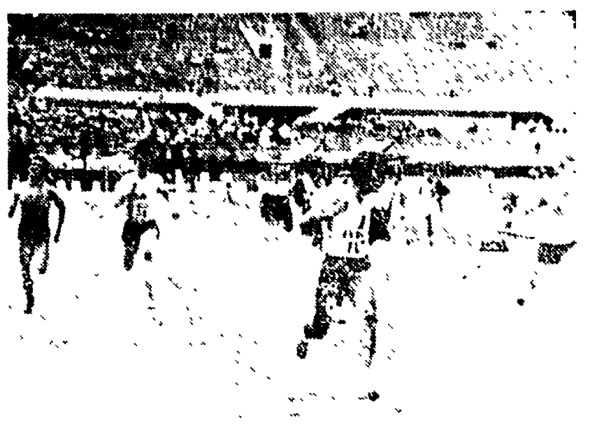
TORINO — Pietro Mennea taglia vittorioso il traguardo nei 200.