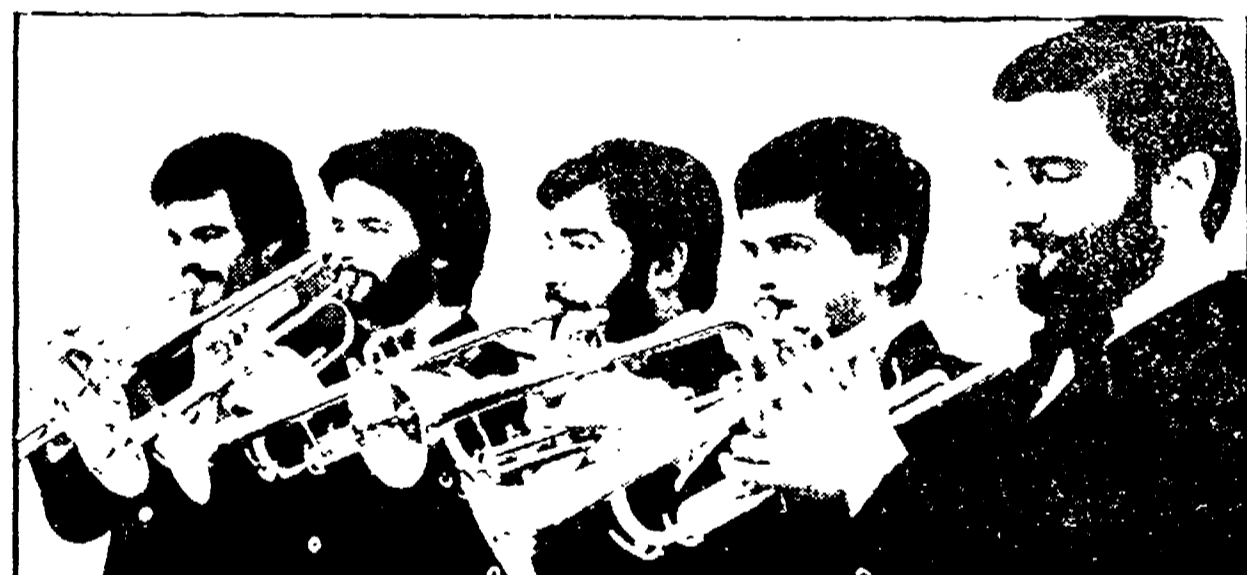
ANCONA: bandito il 1° concorso internazionale di esecuzione musicale per strumenti a fiato

La vertenza è durata più di tre ore. Il processo Botticelli è ripreso oggi. Ancona: bandito il 1° concorso internazionale di esecuzione musicale per strumenti a fiato. Tutti i partiti d'accordo a Pesaro per sistemare il Colle San Bartolo. Approvato il bando di concorso. Un dibattito a 5 sui referendum in una sezione PCI.