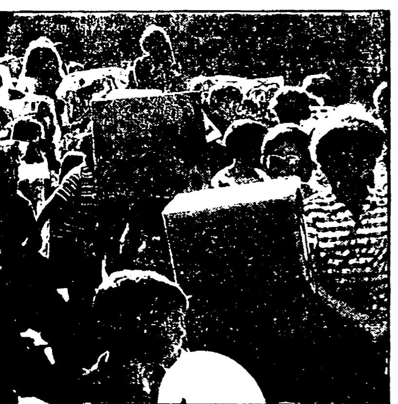
Danza e teatro a Saturnia

La presenza del Parco di Albese, che per essere tale deve per un periodo di tempo essere sottoposto a certe limitazioni, è un problema che non può essere negato. Ma vi è anche la presenza di alcuni cittadini della zona di Albese, che si avverte alla creazione di un parco della Maremma. A sostegno di questa posizione si adducono una serie di motivi che, per gli agricoltori di Albese, possono essere riassunti nella limitazione dell'attività di inizio dell'anno, nei mesi rurali con conseguenze negative per le aziende e la zootecnia.