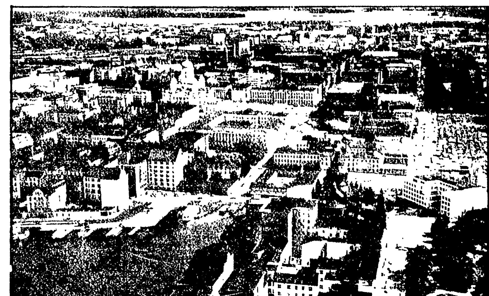
Una veduta del centro di Helsinki

HELSINKI. Attraverso i rami degli alberi del parco il sole mandava nell'aria una calda luce. Era una bella giornata di sole. La gente si muoveva con una certa vivacità. Le donne erano vestite di abiti colorati e di stoffe leggere. Le ragazze portavano i capelli sciolti e le magliette colorate. Le donne erano vestite di abiti colorati e di stoffe leggere. Le ragazze portavano i capelli sciolti e le magliette colorate.