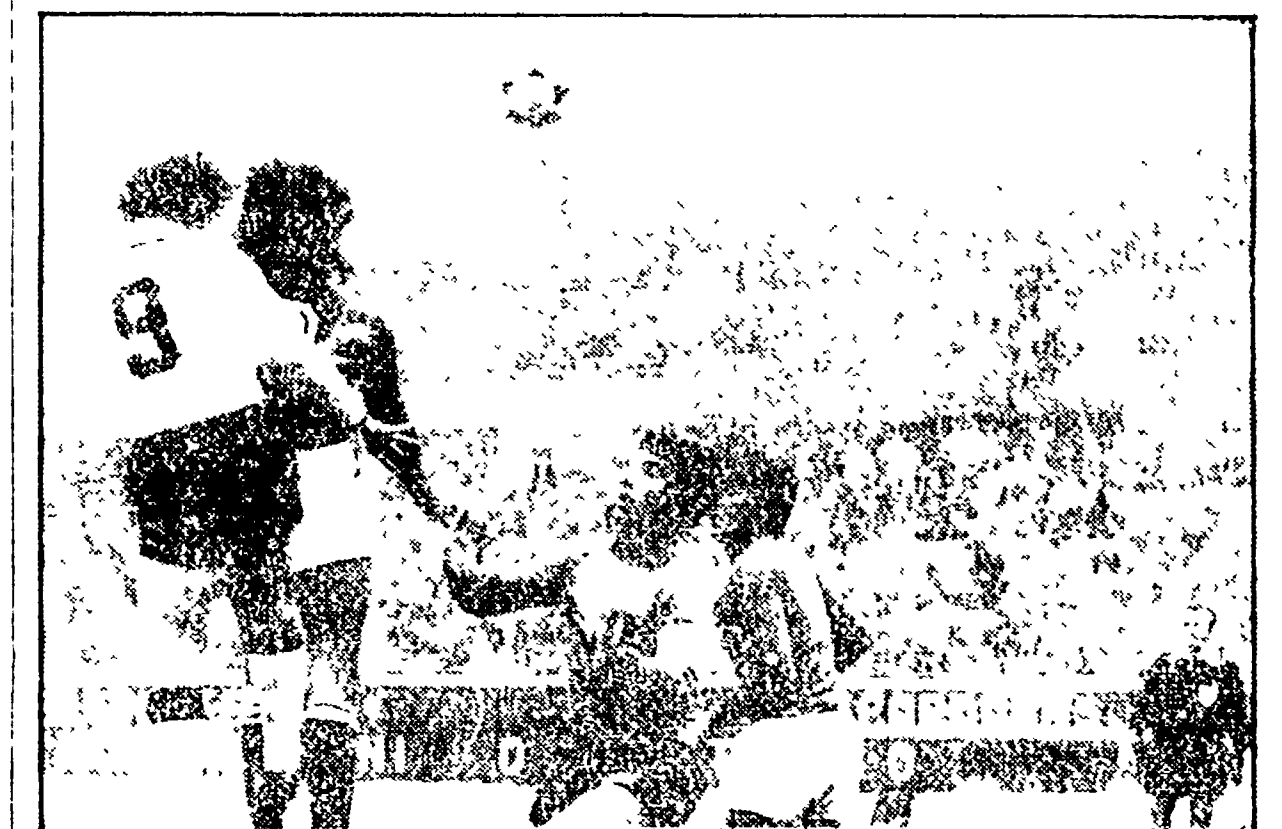
BUENOS AIRES - Un attacco tedesco in area azzurra controllato da Zoff, Scirea e Antognoni

Gli azzurri sono andati più volte vicini al gol - Non sono stati aiutati dalla fortuna - Domenica contro l'Austria