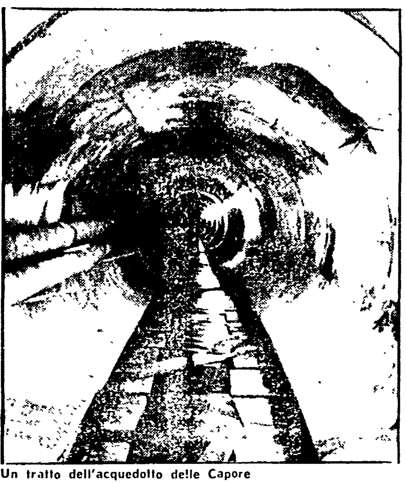
Un tratto dell'acquedotto delle Capore