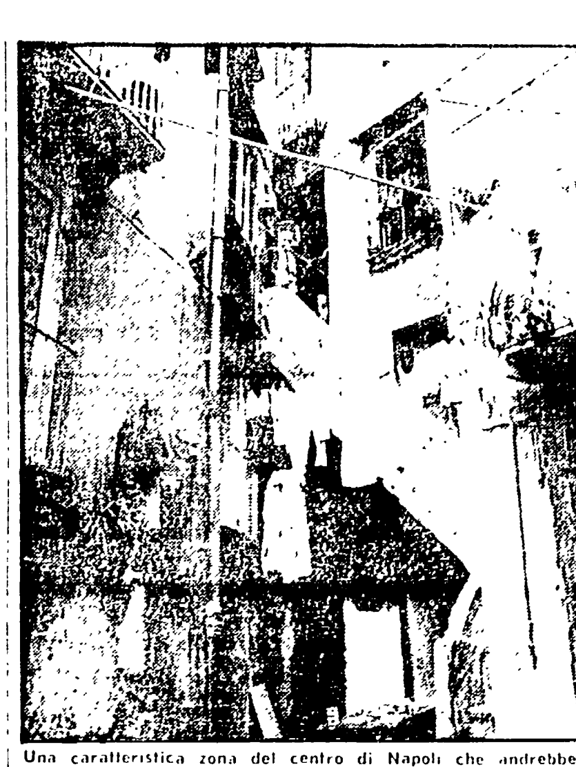
Una caratteristica zona del centro di Napoli che andrebbe ristrutturata