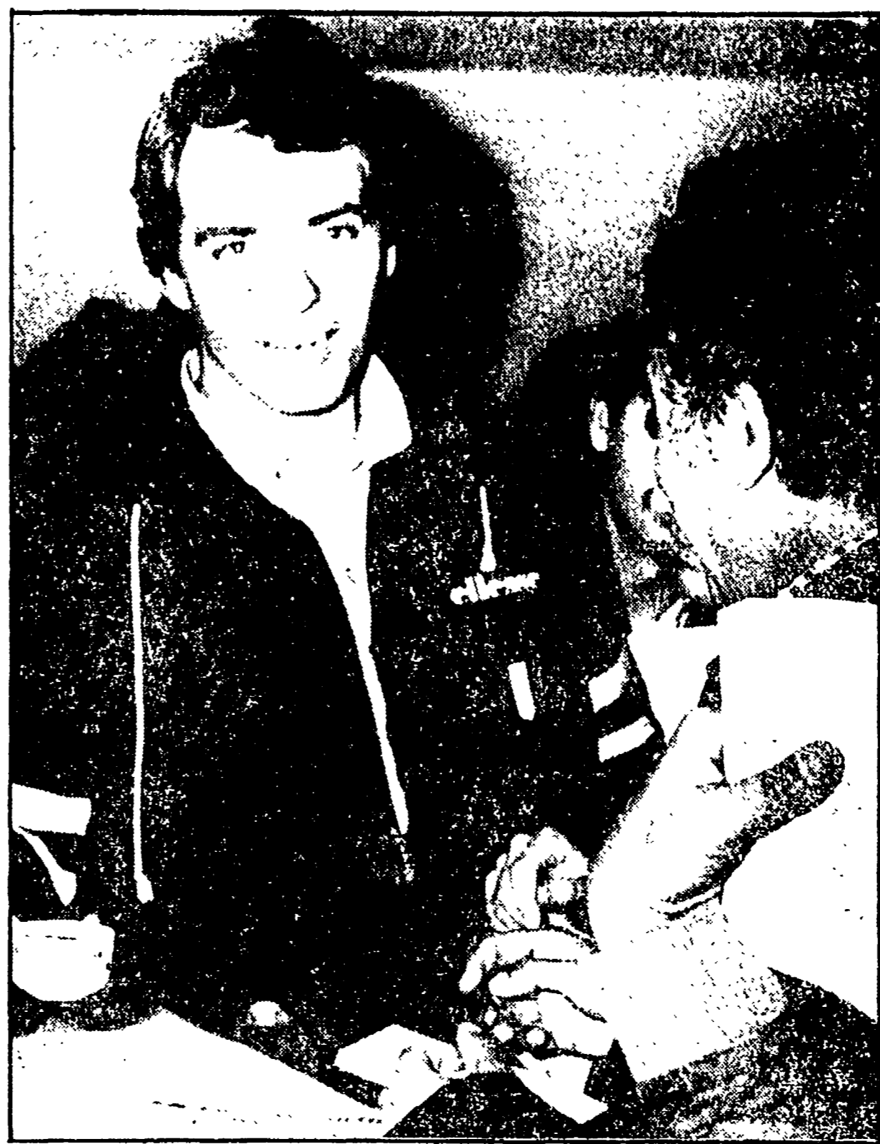
● ROBERTO BETTEGA è stato finora uno degli elementi determinanti del positivo cammino degli azzurri. Su di lui ora saranno accanite tutte le attenzioni per le ultime due partite di semifinale. Si spera nei suoi per battere gli austriaci e gli olandesi e conquistare un posto nella finalissima, traguardo che la squadra di Bearzot ha ampiamente dimostrato di meritare in questo campionato mondiale, che per gli azzurri si presentava con prospettive tutt'altro che rosee

«Una tranquillizante il fatto di essere stato subito considerato titolare non amovibile». «Certo, Mentirei se lo vo scendessi, anche se per me era già stato un traguardo quello dell'inclusione nella lista del 22. Le polemiche per l'alternanza Rossi Graziani che il match di Roma con la Jugoslavia aveva fornito, mi dà una prima impressione, il fatto che Bearzot, contro gli azzurri, non ha avuto la forza di decidere a favore di un'alternanza che ridarebbe la serenità».