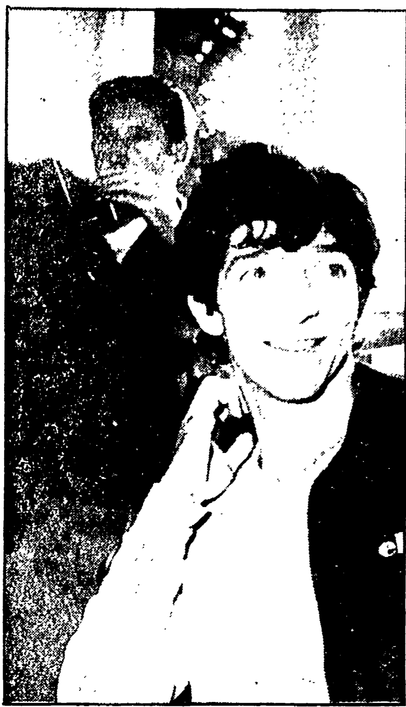
● PAOLO ROSSI è stato al centro di un'antipatica polemica

L'attaccante non esclude come sorpresa l'Italia - Bearzot infuriato per gli attacchi del presidente Farina sull'utilizzazione del vicentino: « Il ragazzo non è una signorinella da salotto »