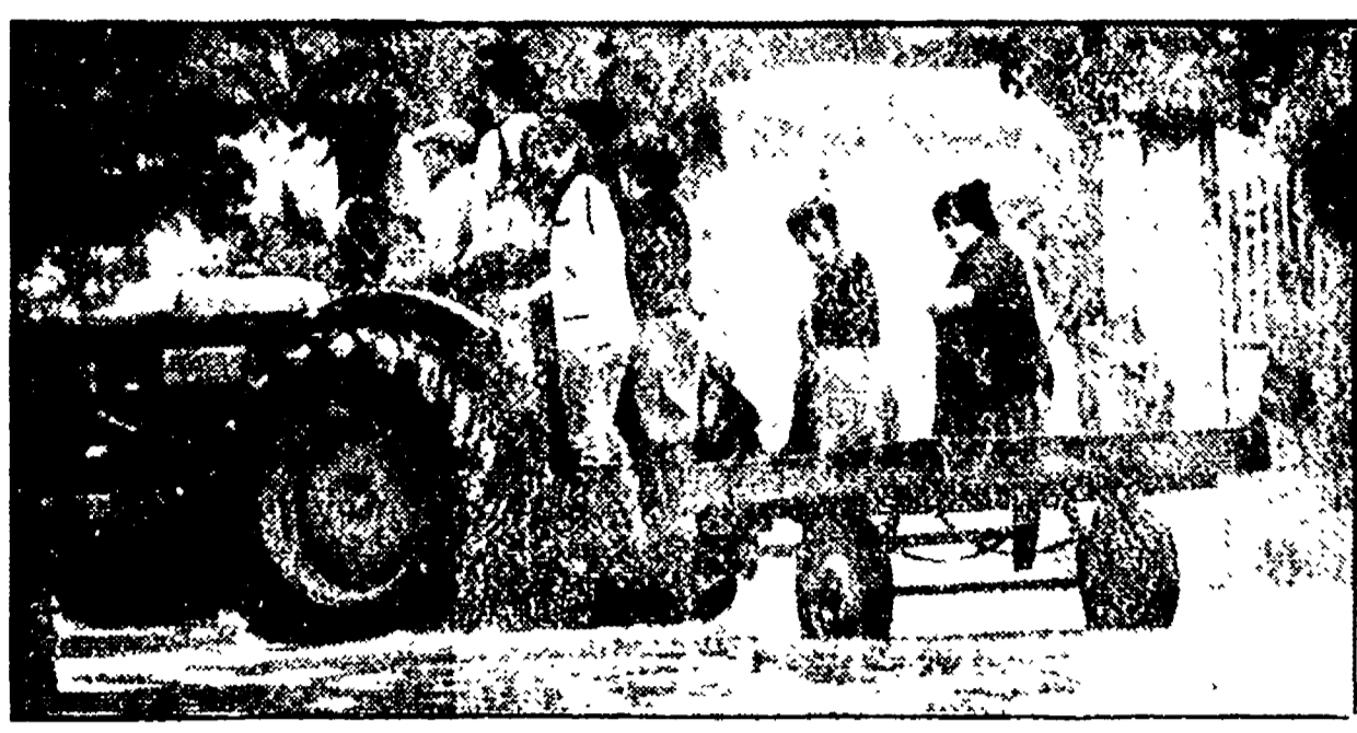
Studentesse e insegnanti della scuola media di Mantignana vanno a scuola in trattore a causa delle siringhe allagate