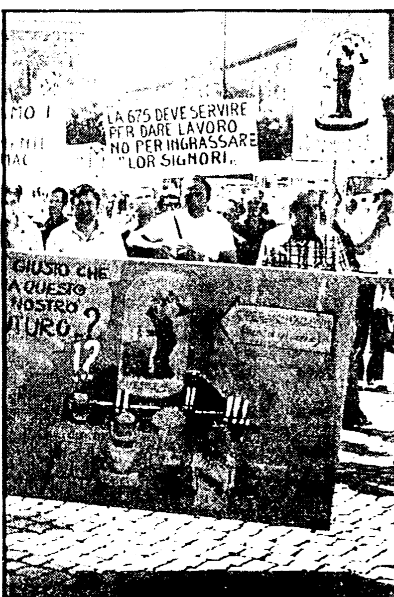
Un primo risultato, la mobilitazione dei lavoratori della Ginece di Pomezia, è riuscito a ottenere durante un incontro, ieri, al ministero del Lavoro.

Gli insegnanti la giudicano « non idonea », ma il TAR la fa ammettere agli esami.