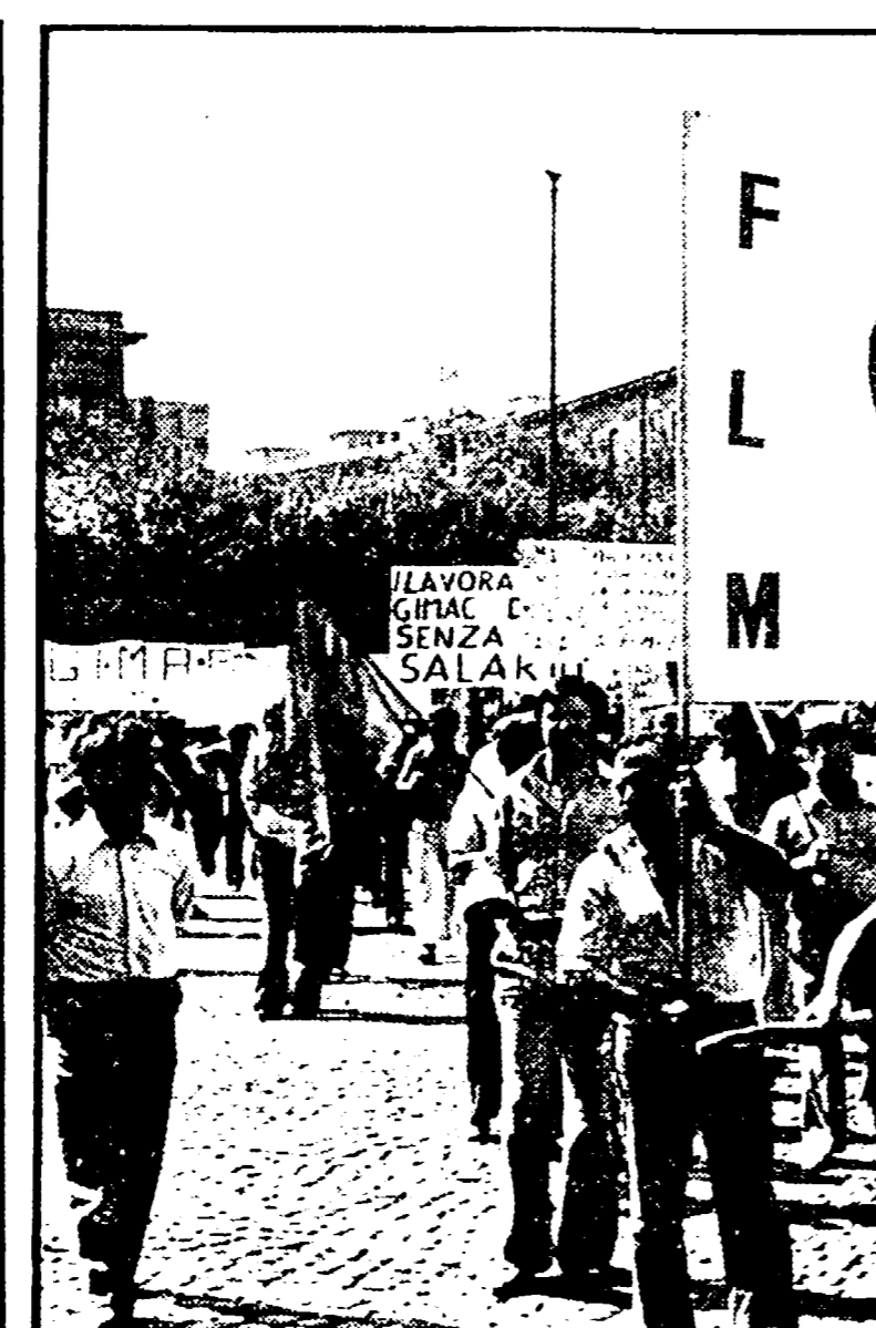
Una prima iniziativa del sindacato si decentra nelle zone. Sciopero oggi a Monterotondo, Domani si ferma la Tiburtina.