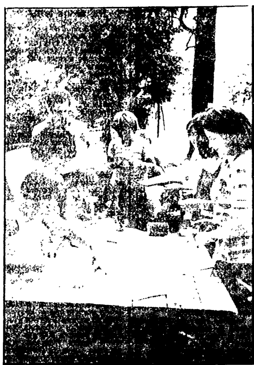
Bambini ai corsi estivi dello scorso anno

Mi e i giardini, laboratori di animazione, palestra, piscine, biblioteche e teatrini: tutti sono a disposizione di oltre 1.000 insegnanti, oltre 1000 che, con alcune eccezioni, lavorano in questi centri, che è fatta un po' di vacanza e un po' di studio, un po' di ricreazione e un po' di lavoro.