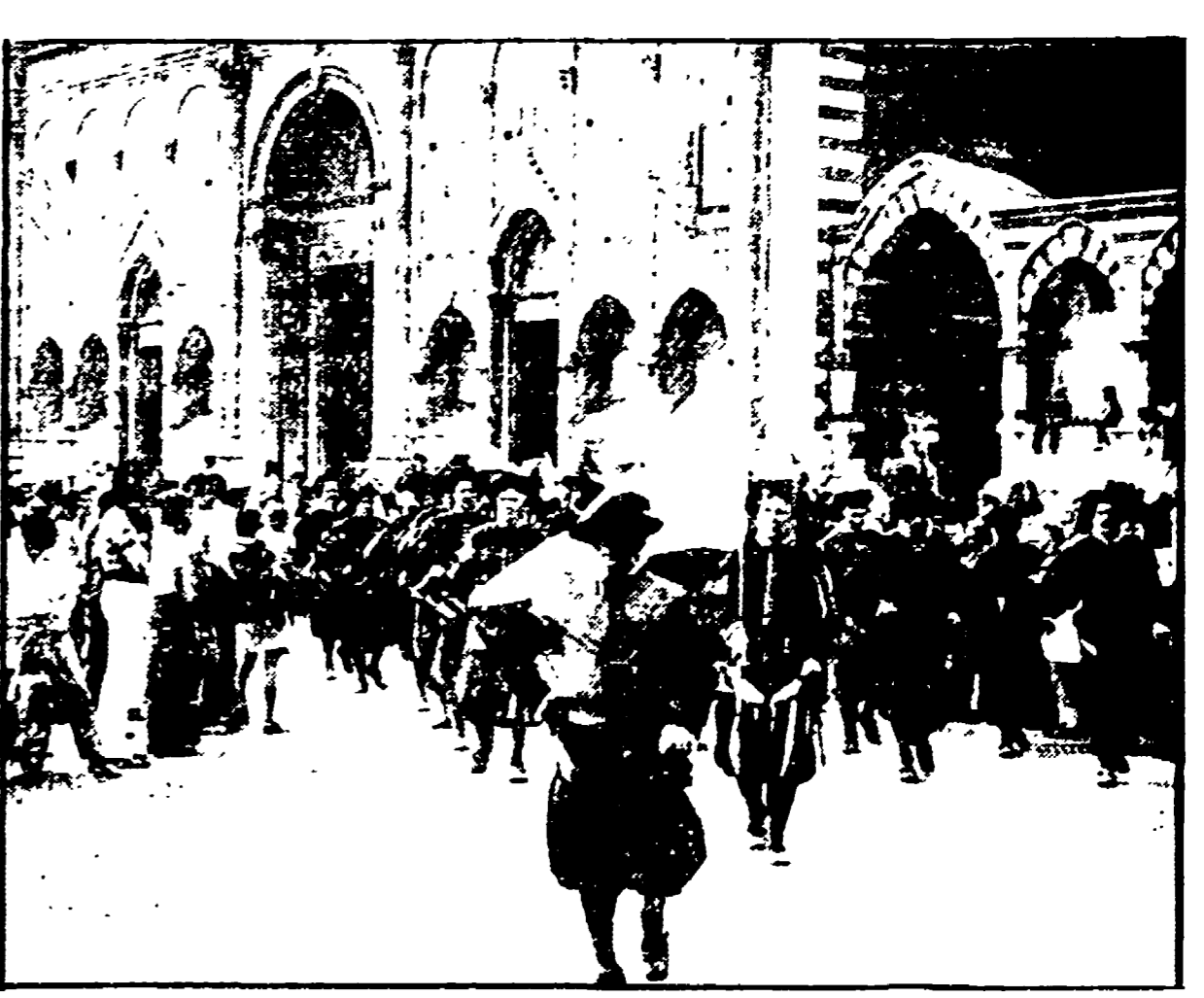
Dal 21 al 27 giugno, in occasione del calcio in costume nel quartiere di Santa Croce sfileranno 5 bande folkloristiche toscane, le stesse che, da anni, animano tutte le occasioni di festa, le sagre paesane. I cinque complessi bandistici sono: la banda Faella, la banda di Zivago di Arezzo, gli Scappati di San Giovanni, la Tarantella di Rignano, la banda di Reggello. L'iniziativa promossa dal comune di Firenze e dal comitato per il calcio storico, in collaborazione con l'ambasciatore (l'associazione che raggruppa tutti i gruppi musicali folkloristici in Toscana) e le associazioni culturali popolari, si svolgerà nel quartiere di Santa Croce, utilizzando la stessa struttura approntata per il calcio storico, nei giorni di intervallo tra una partita e l'altra.