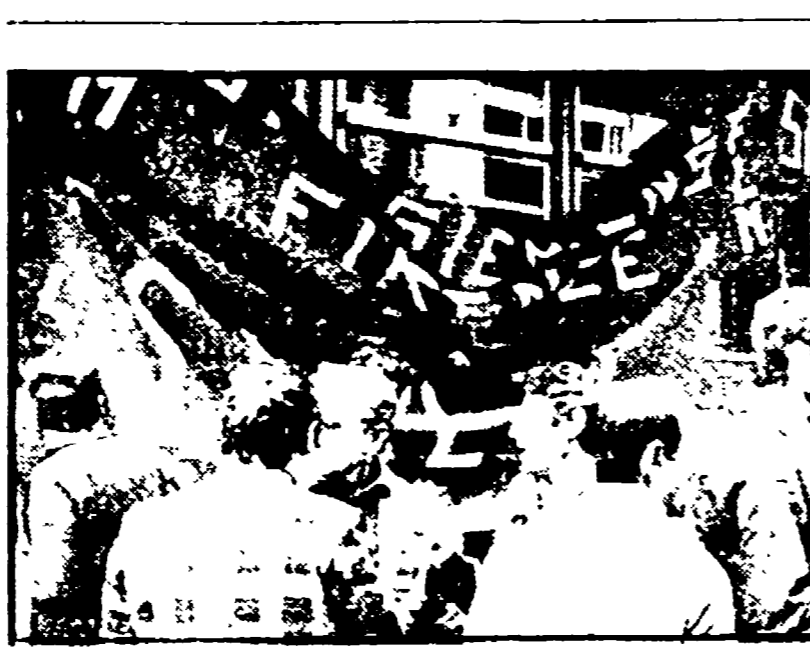
Manifestazione dei lavoratori degli appalti telefonici contro la SIP

Oggi, comunque, potrebbe venire una schiarita dall'incontro tra organizzazioni sindacali e direzione compartimentale, la quale non si è dimostrata molto preoccupata a tal punto che nella precedente riunione non ha presentato nessuna proposta che potesse, in qualche modo, agevolare una soluzione.