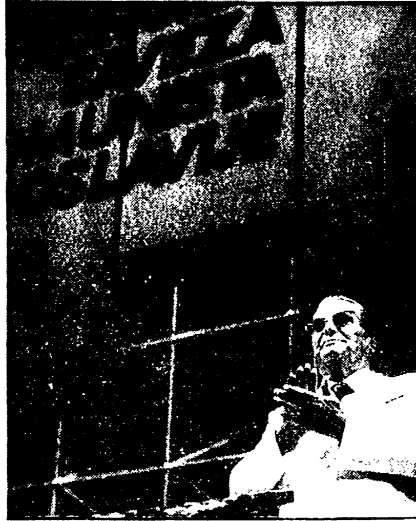
BEGRADO — Il presidente Tito mentre legge il suo rapporto all'11° congresso