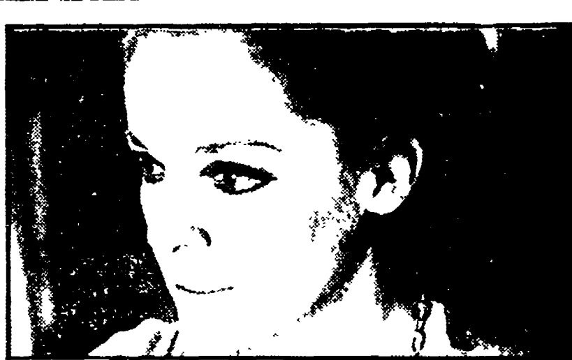
Anna Proclemer in «La voce umana» (Rete 2, ore 22,55)