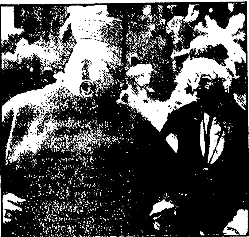
Dal nostro inviato

Un vasto fenomeno dai ruvidi risvolti ideologici