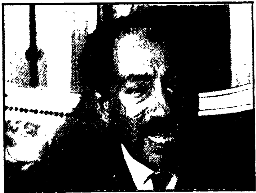
Il presidente Sadat

Dall'intervista rilasciata da Sadat a Ring '78 e andata in onda martedì sera, risultano con chiarezza quattro cose: il desiderio di pace del presidente egiziano, la nostalgia per il vecchio Egitto rurale e patriarcale; l'insistenza nei confronti dei critici di qualsiasi colore; la ostilità riserata verso l'URSS e tutto ciò che "sa" di "comunismo"; l'ostilità temperata, con abilita tattica, da riconoscimenti di "patriottismo" rivolti ai partiti comunisti europei, in particolare al PCF e al PCI.