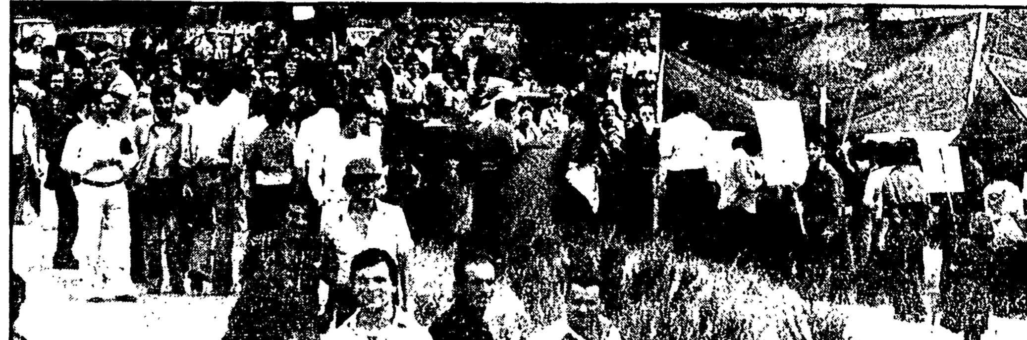
Manifestazione a Cagliari sulle aree della zona industriale

Il presidente Mattarella ha chiesto la fiducia su un emendamento al progetto di legge per i terremotati presentato dal PCI.