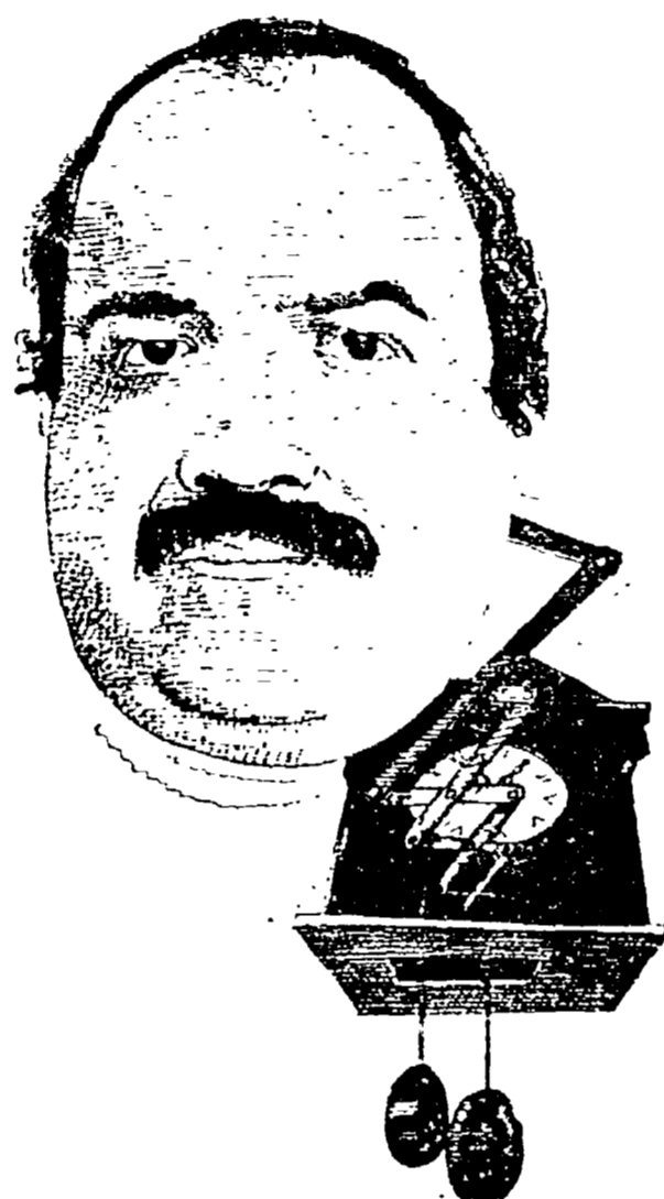
Una caricatura di Costanzo eseguita da Paolo Guidotti

di visto una qualsiasi cosa, ma per il pubblico, che in teoria, il loro professore, giudice dello, da teleselezione di gusto, politicamente avvertito e con una sua eleganza intellettuale.