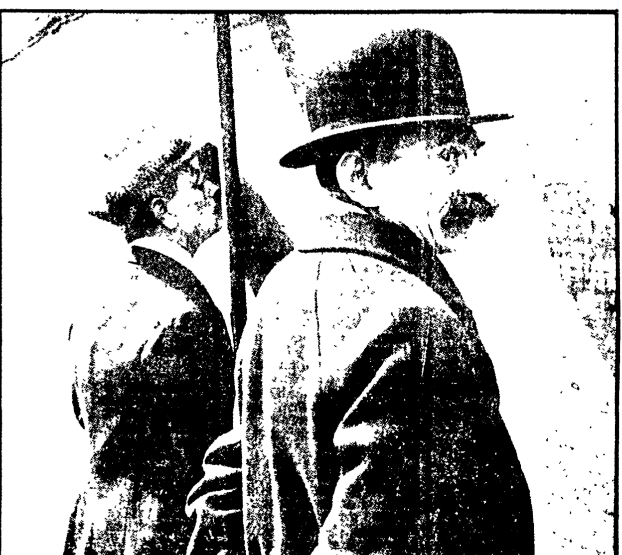
LE FOTO DI CARTIER-BRESSON — Dopo il grande successo delle opere di Alberto Savinio, il palazzo delle esposizioni offre un'altra mostra... LE FOTO DI CARTIER-BRESSON.