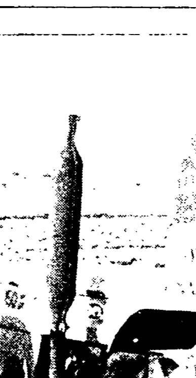
Barri - L'esperienza di una coop di giovani a Minervino Murge