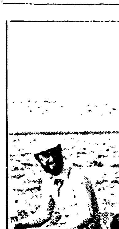
Non viene tutelata la salute dei lavoratori di Radiologia