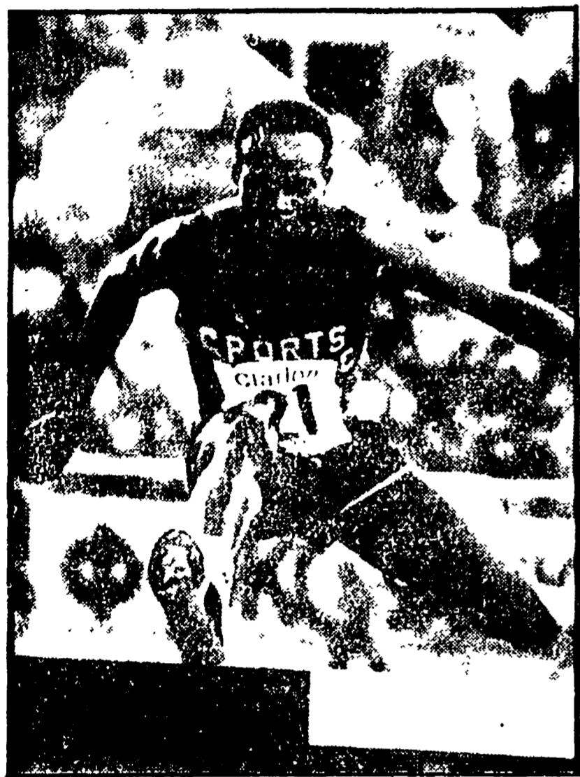
RONO il prestigioso detentore di tre « mondiali »

Contro il « mondiale » Moses (400 ostacoli), Foster e Nehemiah (110 ostacoli) Pietro Mennea sfida Edwards - Sara Simeoni riprova il record dei due metri