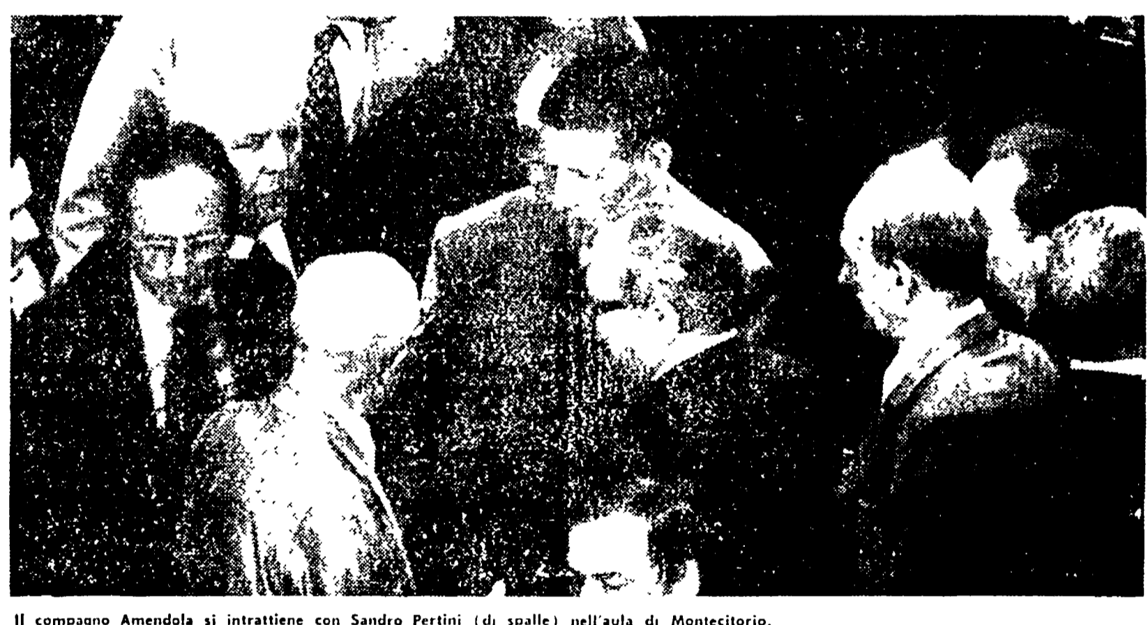
Il compagno Amendola si intrattiene con Sandro Pertini (di spalle) nell'aula di Montecitorio.