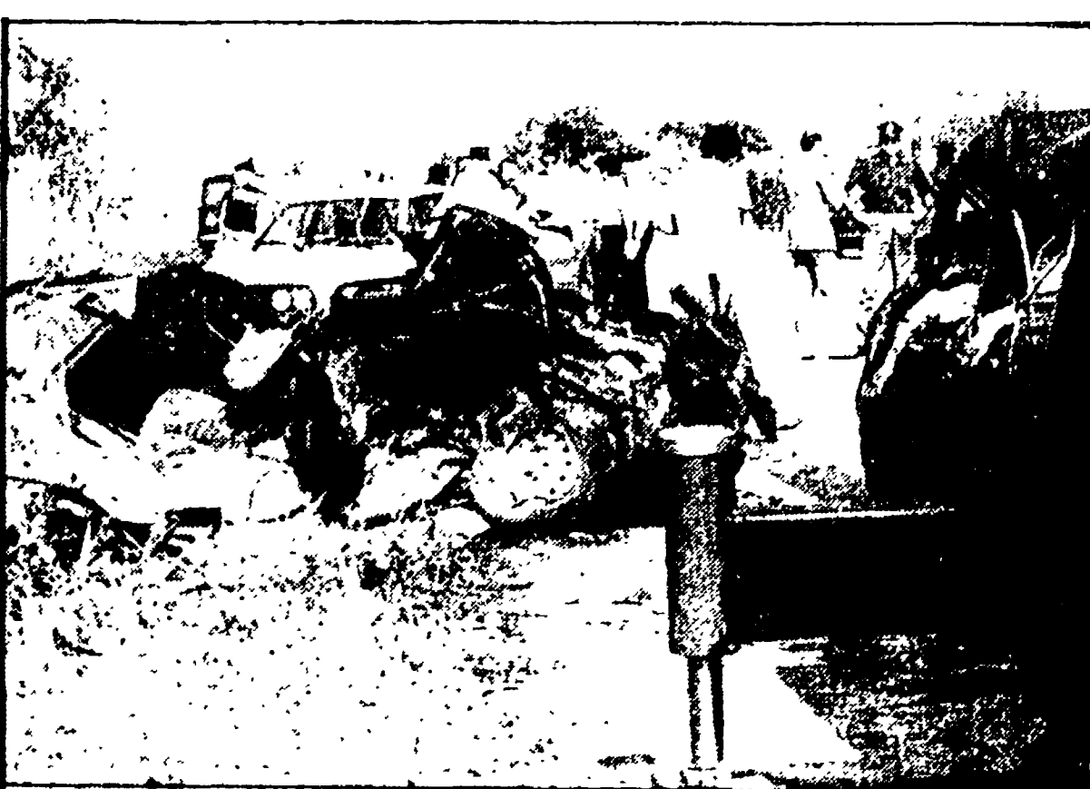
FERRARA — I resti delle autovetture dopo lo scontro