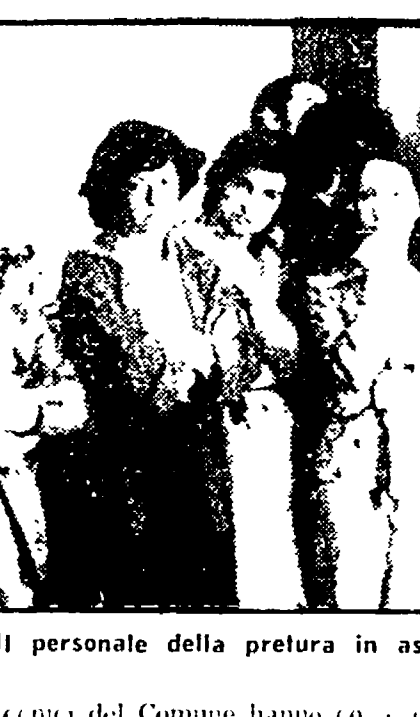
Il personale della pretura in assemblea

Ieri mattina i pretori, i cancellieri e gli ufficiali giudiziari della pretura fiorentina si sono riuniti per esaminare la situazione dopo il gravissimo attentato terroristico compiuto contro gli uffici della sezione sfratti da un commando delle «squadrine proletarie di combattimento».