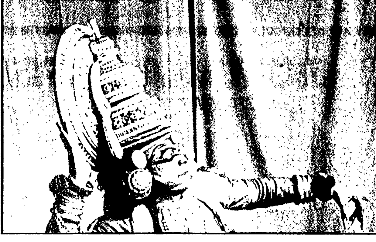
SALERNO - Domenica l'apertura in villa comunale