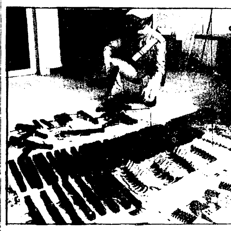
TORINO - Dieci persone sono state arrestate ieri mattina dai carabinieri di Torino in una fabbrica clandestina...