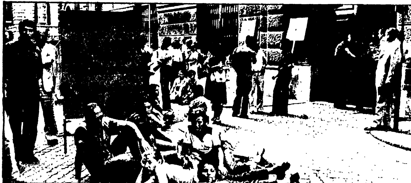
Lavoratori e lavoratori dell'Amuco di Avellino, davanti al ministero del Lavoro mentre aspettano di essere ricevuti dopo una notte di viaggio e alcune ore di attesa

Cento lavoratori della fabbrica avellinese hanno atteso invano di parlare col ministro - Impossibile l'incontro tra le parti - Le proposte di De Mita si sono rivelate inconsistenti - Continua la lotta