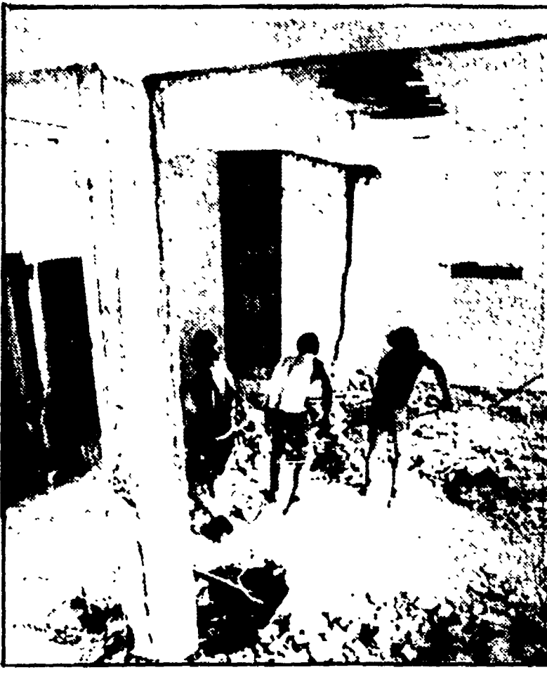
MILANO - I danni alla caserma dei CC causati dall'esplosione