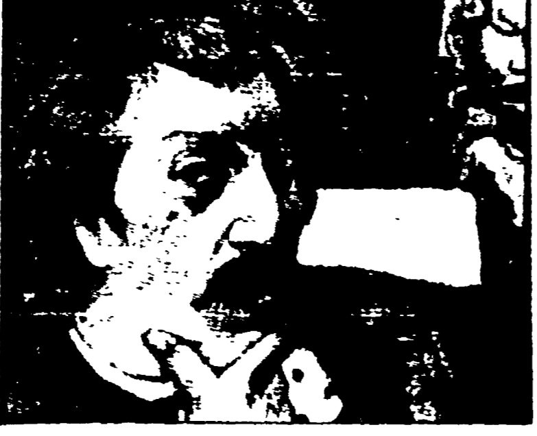
Paul Gauguin, lupo senza collare (Rete 2, ore 22)

Il favoloso del mare, questo è il titolo della seconda puntata della serie incentrata su «Storie di pesci e cacciatori del Mediterraneo»; la troyade del programma parte da Hammamet per una località a nord della città dove si trovano i resti di alcune piazze. Si potrà però assistere a una lunga immersione all'interno di una nave naufragata e al dismessio sott'acqua di una mucca giacetessa.