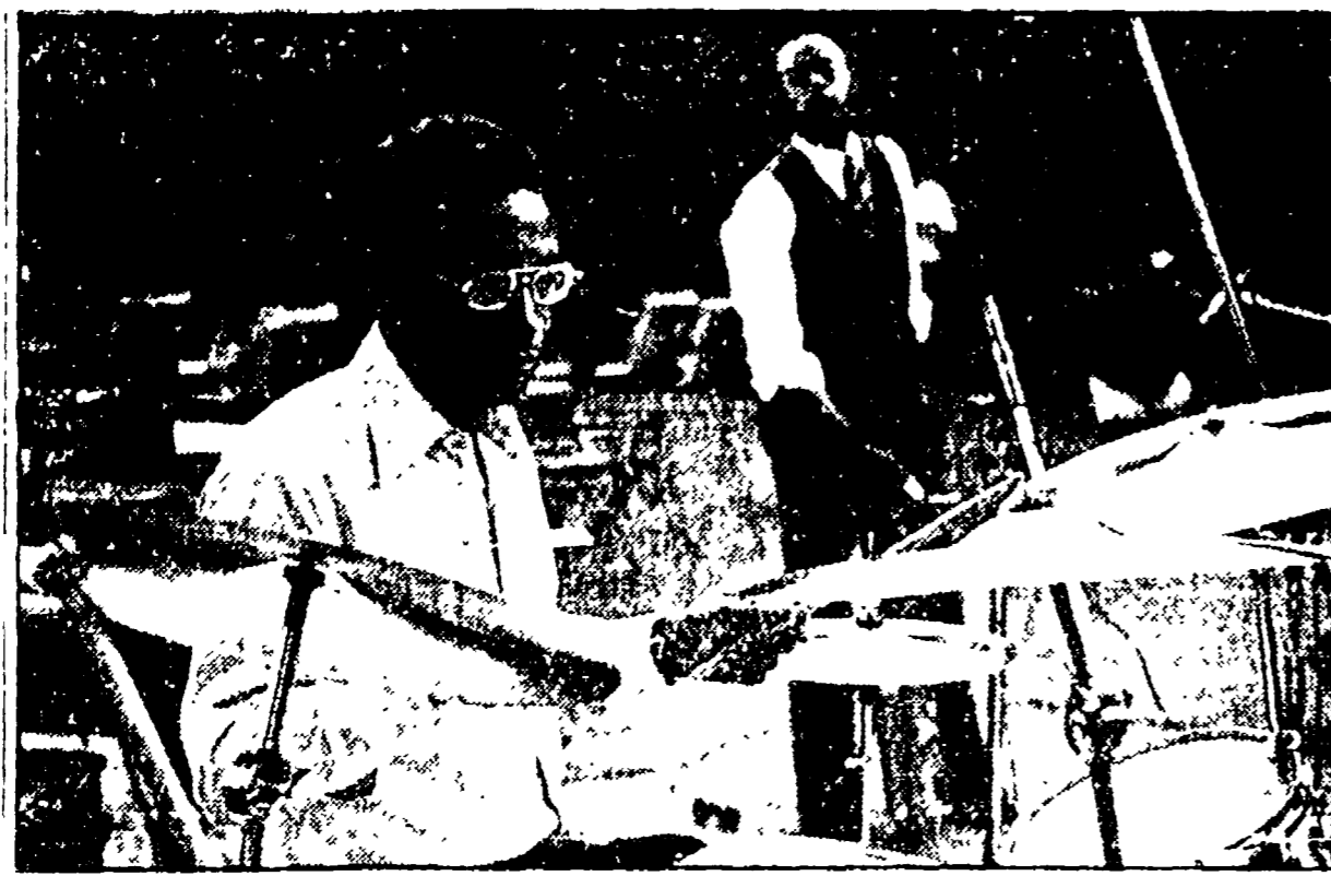
Max Roach con Archie Shepp a Roma al concerto al Festival dell'Unità della Mole Adriana

Gli inizi con Parker, Ellington e Armstrong - La situazione e i problemi degli afro-americani dopo gli assassini di Malcolm X e Luther King - «Mi rallegro di lavorare con giovani musicisti»