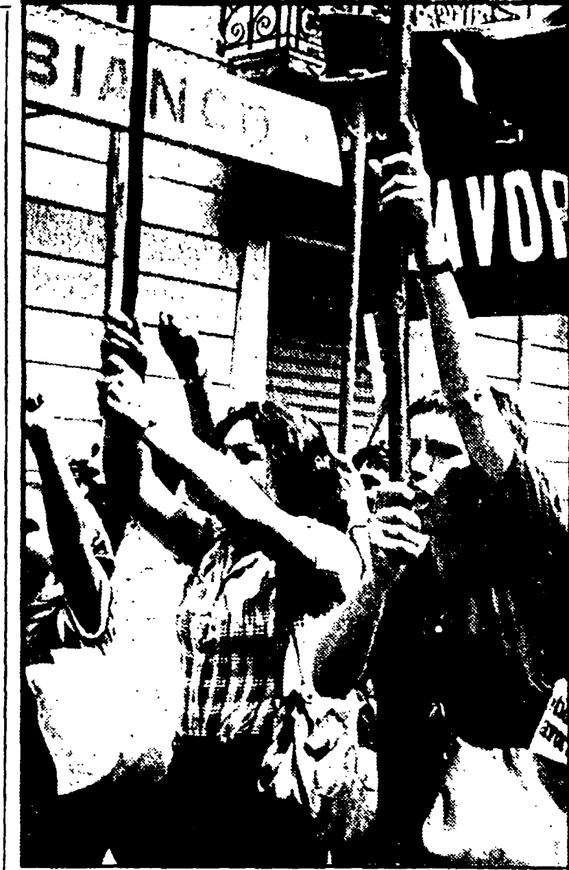
I disoccupati calabresi scendono di nuovo in lotta