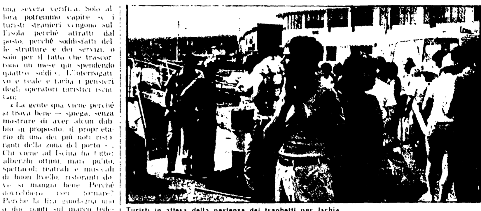
Turisti in attesa della partenza dei traghetti per Ischia