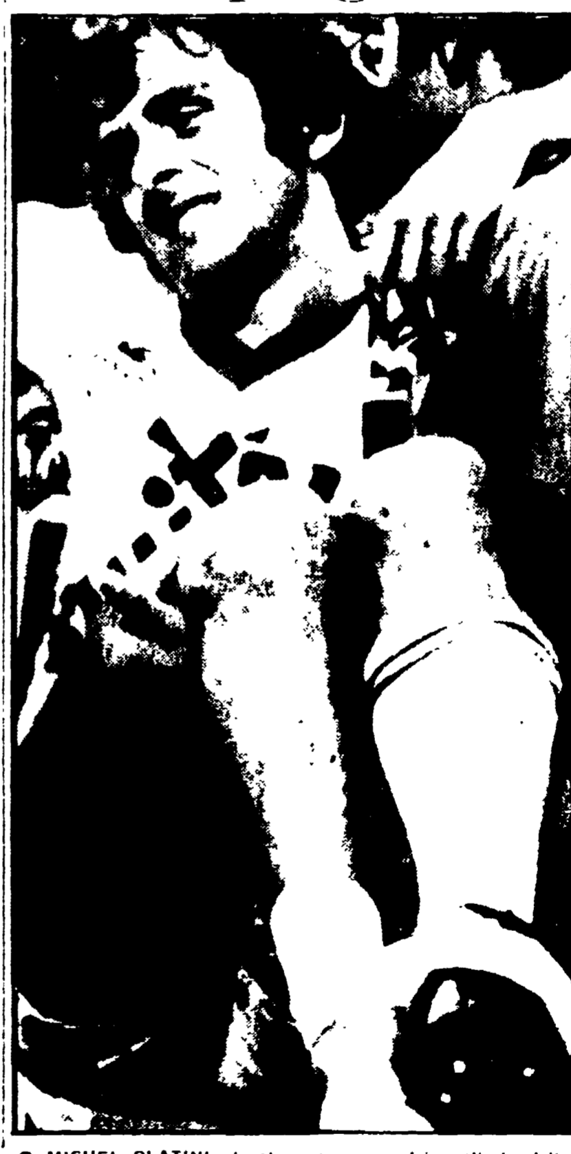
● MICHEL PLATINI, il capitano del Nancy e della nazionale francese infortunato nella partita di campionato contro il Saint Etienne, ha riportato le fratture del polso e dei malleoli della caviglia. Platini dovrà subire un intervento chirurgico per la riduzione delle fratture e ne avremo per almeno tre mesi.

Pugilato Il giapponese Kuko nuovo mondiale dei «medi jr.»