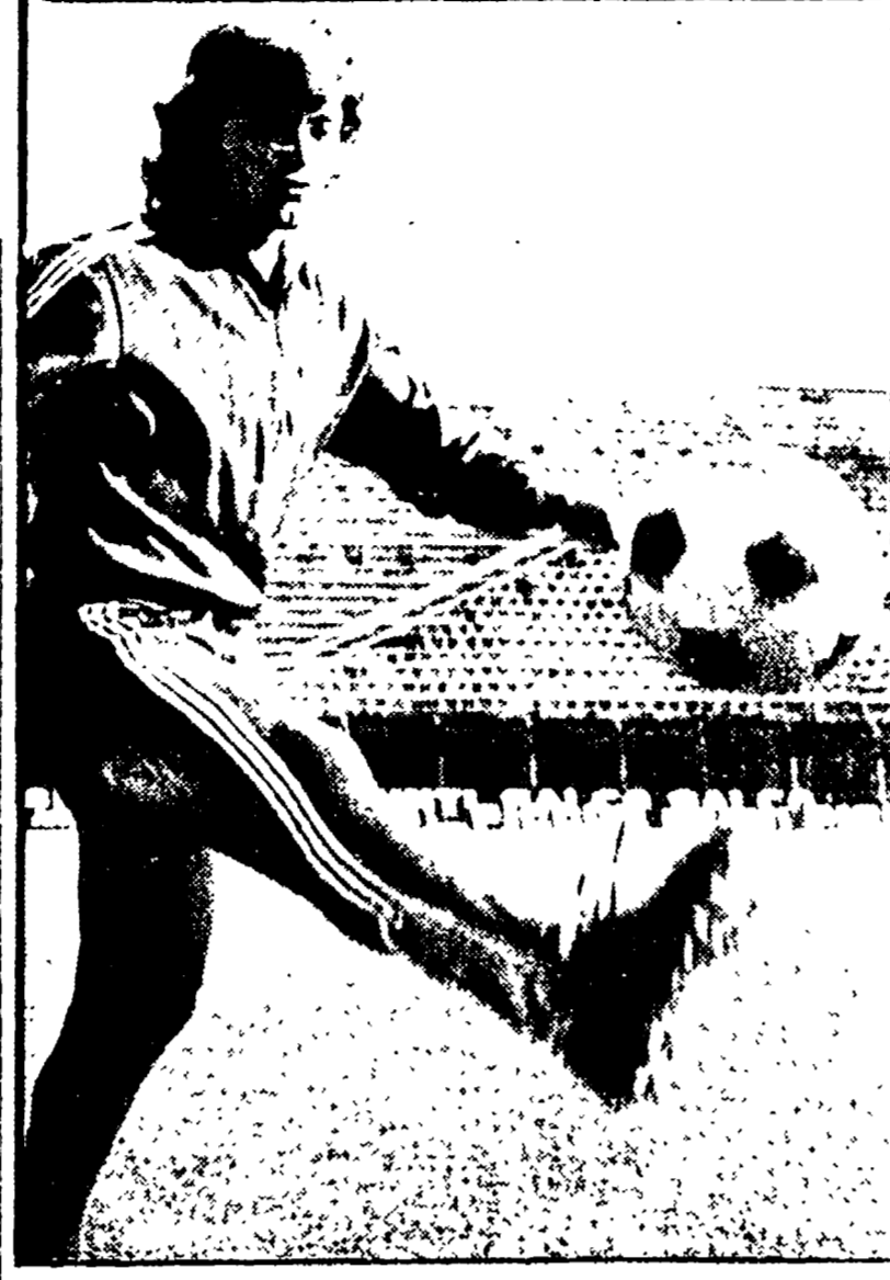
● GIANCARLO ANTOGNONI, la mezzala della Fiorentina e della nazionale