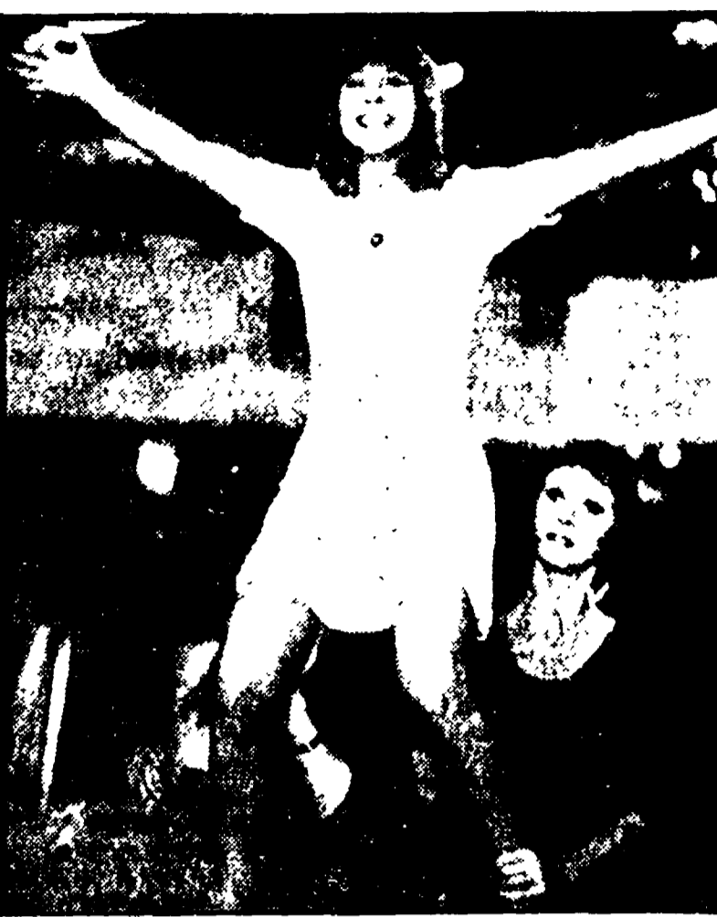
Margarethe Von Trotta in una scena del film tedesco «Fuoco di paglia» presentato alcuni anni fa alla Mostra del cinema di Venezia...