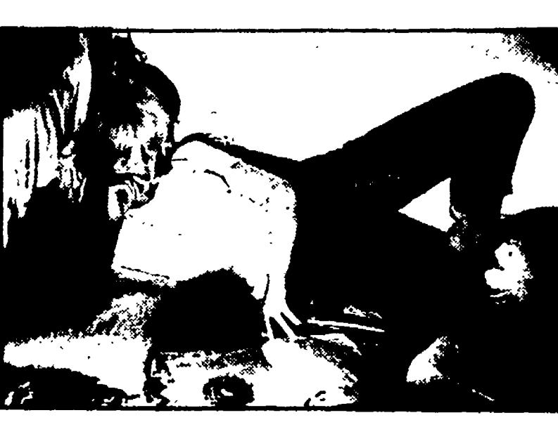
Brigitte Bardot a Videovera in «La fortuna di essere bionde» (Rete 2, ore 21,15)