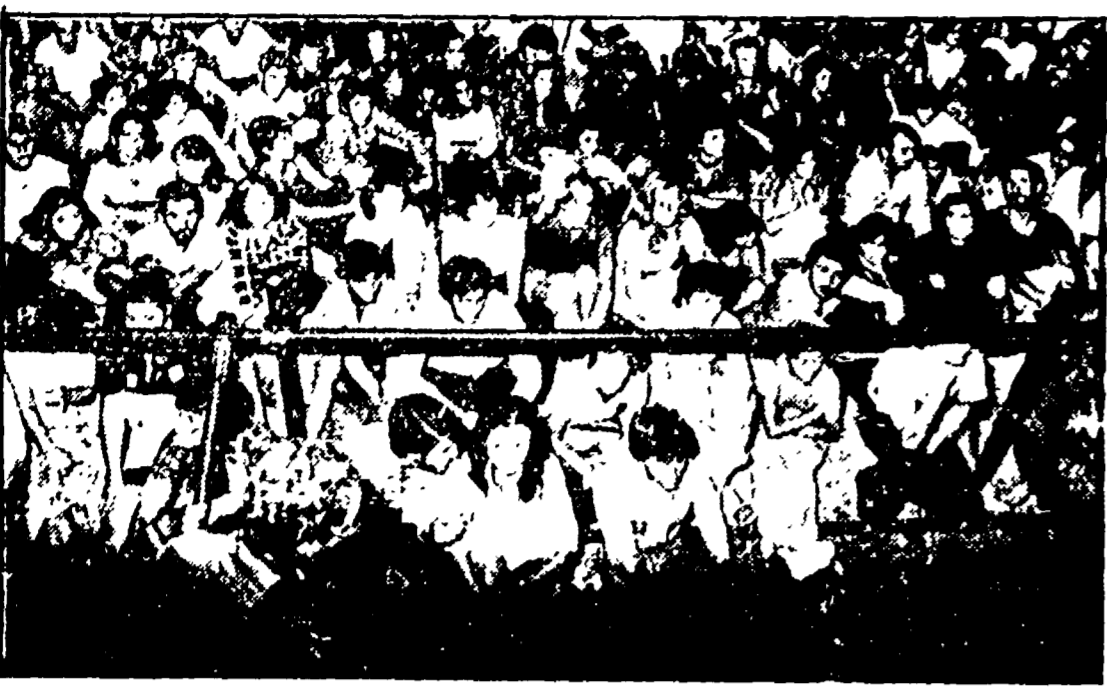
Un'immagine consueta nei tanti festival della Toscana