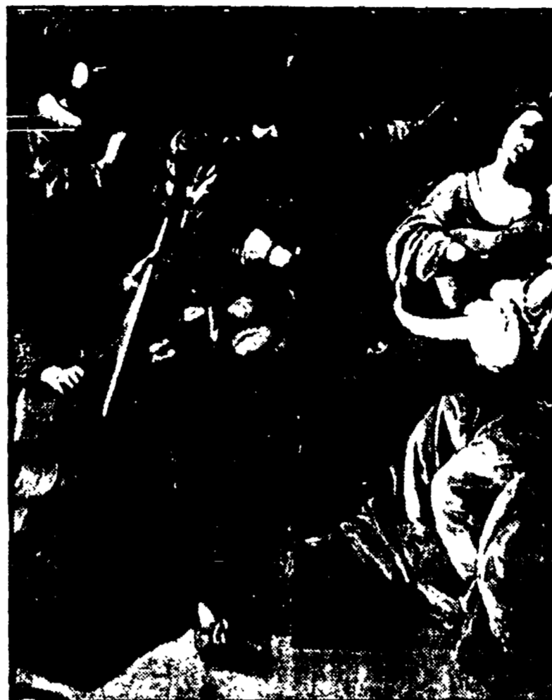
«La sonata da Camera», uno dei quadri esposti a Siena

Ben al di fuori del ristretto giro degli addetti ai lavori, la grande mostra organizzata dalla città di Siena per il «vino» pittore Rutilio Manetti merita senz'altro un meditato richiamo e quindi un dovuto inquadramento nel giro delle più qualificate manifestazioni espositive allestite durante questa stagione.