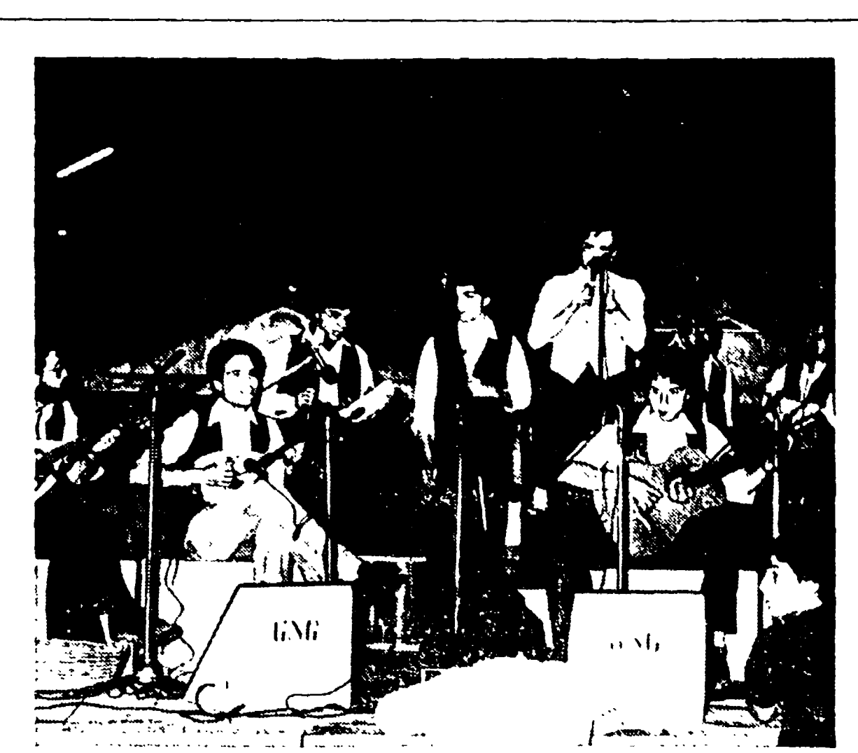
L'esperienza del gruppo sardo «Nuova generazione»

PALERMO — La presa di posizione è netta: la Regione Siciliana contesta fermamente i principi ispiratori dei piani di settore per la chimica e la siderurgia. I principi, infatti, da «gravi difetti», appaiono in contrasto con gli interessi del Mezzogiorno, contenendo «manifestamente pericolosi» che finiscono con il «penalizzare» la Sicilia e dal punto di vista dello sviluppo economico e da quello strettamente occupazionale, prospettando nei fatti un grave «diminuzione» dei posti di lavoro.