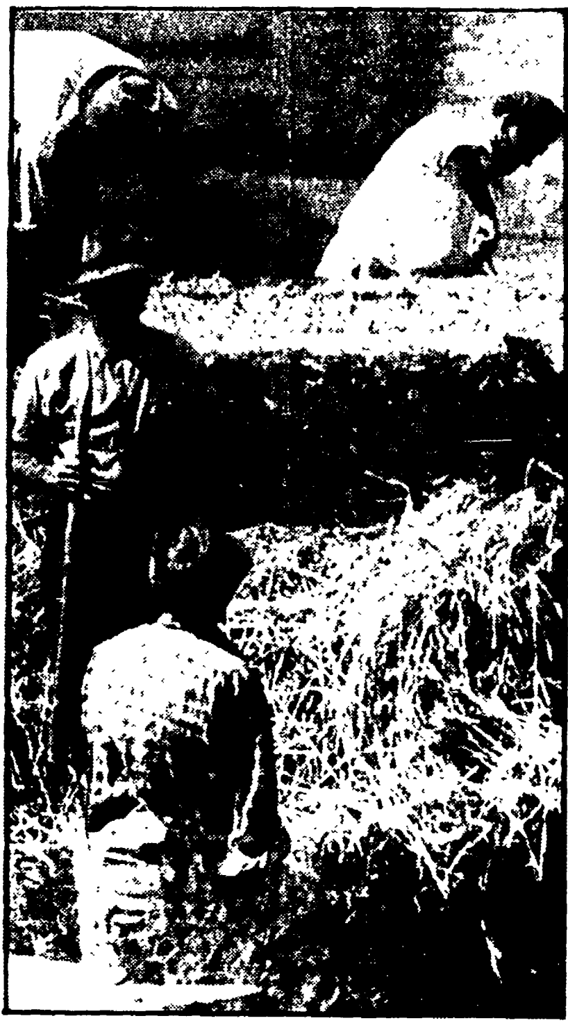
Paolo De Simonis NELLA FOTO a fianco: contadini toscani al lavoro

polari: come lavorava, cosa mangiava, di che tipo di comunicazioni e d'informazione poteva disporre, quali erano i rapporti di gerarchia, quali erano le idee, i valori più diffusi. Oltre ad una serie di fotografie documentative della vita del contadino artino il resto contiene infatti una lunga intervista che ricostruisce il quadro del tessuto quotidiano della cultura contadina; la composizione della famiglia, la divisione del lavoro tra capoccia, massai, figli e figlie, il ruolo del prete e del parroco, l'emigrazione stagionale ecc.