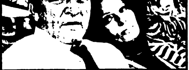
Richard Burton e Sophia Loren in «Breve incontro» (Rete 1, 20.40)