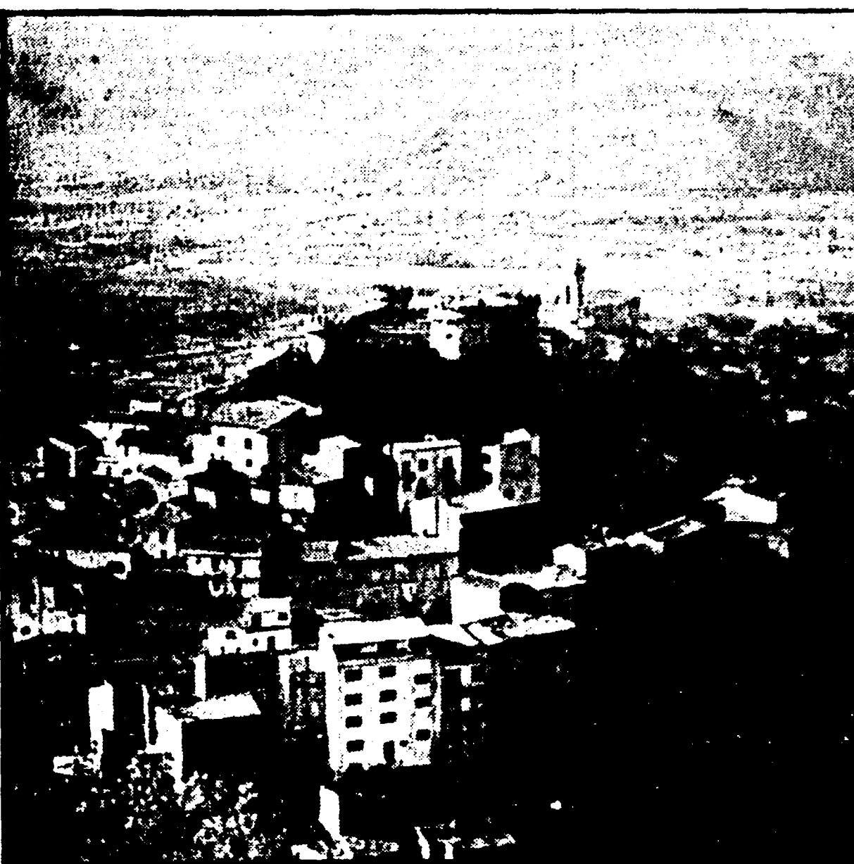
Monteroduni, uno dei paesini più suggestivi dell'Isernia, con il castello Pignatelli