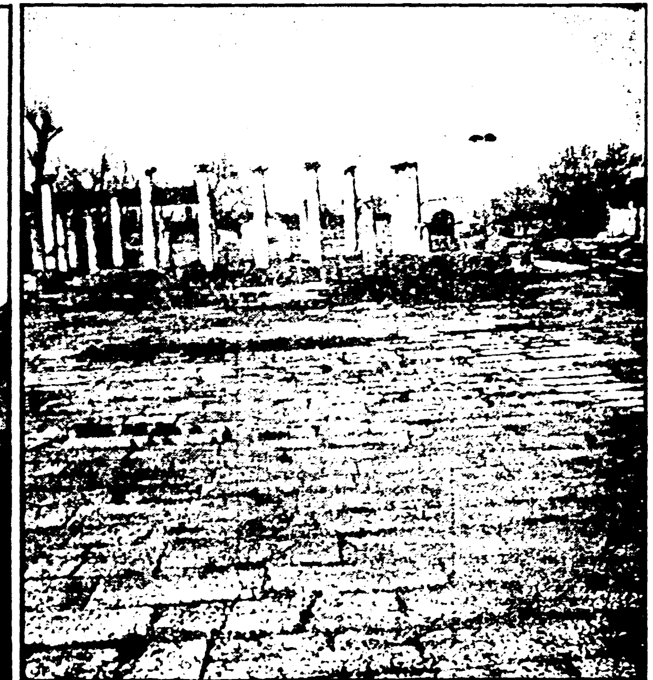
SEPINO - La platea del foro e le colonne della basilica