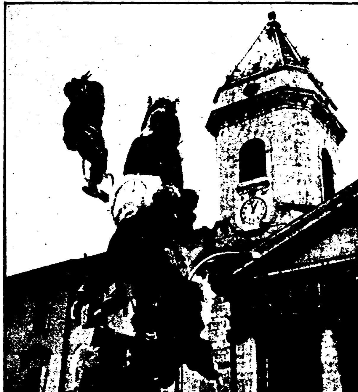
CAMPORBASSO - La processione dei misteri davanti alla cattedrale