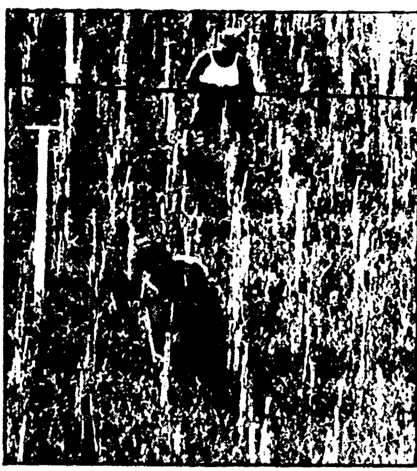
La coltivazione del garofano a pieno campo

Un giro d'affari che supera i 30 miliardi, 1500 aziende, 12.000 occupati - Un «impero del fiore» che interessa tutta la Val di Nievole - La mostra-mercato di quest'anno riveste un carattere internazionale