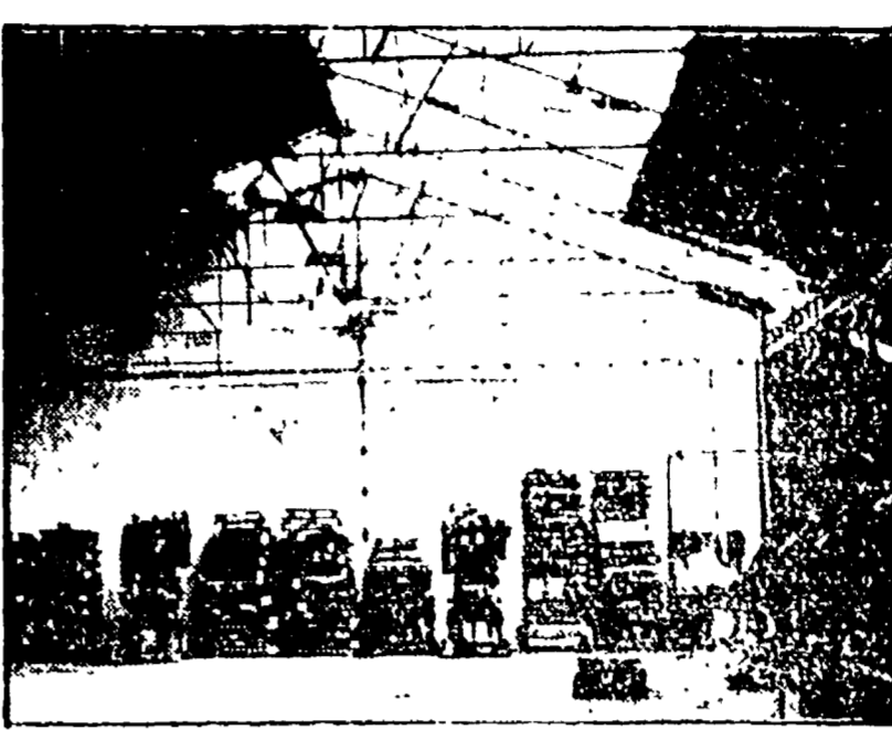
Un capannone scoperciato per il nubifragio

Sono stati danneggiati più di quaranta stabili - Una scuola prefabbricata è stata letteralmente sollevata da terra e sospinta dal vento per decine di metri